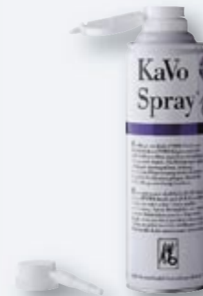
KaVo Spay Instrumenttien puhdistus- ja hoitooly. Ympäristöystävällinen aerosoli kaikille KaVo - instrumenteille. 0.411.9630 (1x500ml) 0.411.9640 (6x500ml)