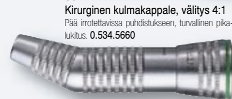
3624 N Kirurginen kulmakappale, välitys 4:1 Pää irrotettavissa puhdistukseen, turvallinen pikalukitus. 0.534.5660