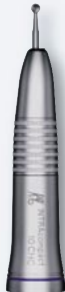
INTRAcompact 10 CHC Käsikappale 1:1 Suora käsikappale. Valoton, sisäinen jäähdytys, käsi- ja kulmakappaleporille, erilliset ilma- ja vesikanavat. Maksimi kierrosnopeus 40.000 k/min. 1.003.7716