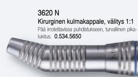
3620 N Kirurginen kulmakappale, välitys 1:1 Pää irrotettavissa puhdistukseen, turvallinen pikalukitus. 0.534.5650