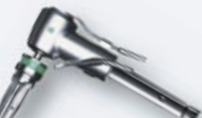
C3 Kirurginen kulmapää, välitys 3:1 Ulkoinen ja sisäinen jäähdytys kulmakappaleporille, Kirschner&Meyer. 1.001.4503