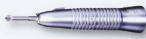
INTRA LUX CL 10 Kirurginen käsikappale 1:1 Kirurginen käsikappale. Käsikappaleporille, pituus 44,5mm. Väliholkillä myös standardiporat. 25.000 Lux kultuoptiikka, ulkoinen jäähdytys. Työskentelynopeus 300-40.000 k/min. 1.002.0911