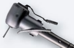
67 RIC Kirurginen kulmapää, välitys 4:1 Ulkoinen ja sisäinen jäähdytys kulmakappaleporille, Kirschner&Meyer. Vahvistettu pää, painonappikinnitys. 1.540.8340