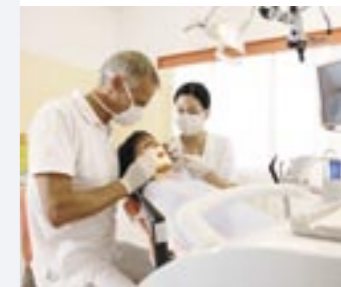
DIAGNOdent pen 2190 Kariesmittari Laservalolla toimiva johdoton kariesmittari. Laajasti tutkittu, innovatiivinen apuväline piilokarieksen havainnointiin. Laite lähettää laservaloa hampaalle ja vastaanottaa takaisin heijastuvan valon, antaa löydöksestä akustisen ja numeerisen arvon. Kolme safiirikärkeä, okklusaali-approksimaali- ja parodontaalikärki. Kätevä ja helppokäyttöinen. 1.002.7000