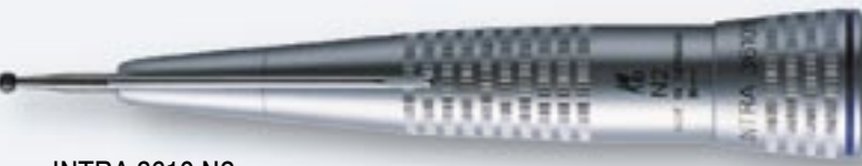
INTRA 3610 N2 Käsikappale 1:1 Käsikappaleen pituus 95mm. Ulkoinen jäähdytys. Ruostumaton teräs pitävällä rihtauksella. 2,35mm, 45-65mm pitkillä standardi käsi- ja kulmakappaleporille. 0.524.5610