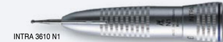
INTRA 3610 N1 Käsikappale 1:1 Kirurginen suora käsikappale. Käsikappaleen pituus 85mm. Ulkoinen jäähdytys. Ruostumaton teräs pitävällä rihtauksella. 2,35mm, 45mm pitkillä standardi käsi- ja kulmakappaleporille. 0.524.5600