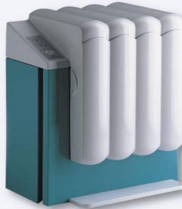
QUATTROcare Air 2104 A Öljyamislaite Täysautomaattinen öljyamis- ja puhdistuslaite. Öljyä ja puhdistaa 4 instrumenttia samanaikaisesti minuutissa. Automaattinen spraykanavien puhdistus. Helppo, nopea ja varma - sopii jokaiselle vastaanotolle. 0.411.7800