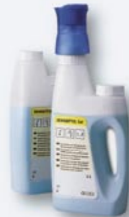
DEKASEPTOL Gel Käyttövalmis imujärjestelmien desinfiointigeeli. Helppo, tehokas, taloudellinen, turvallinen. Geelimäisenä pitkä vaikutusaika, turvallinen ja miellyttävä käyttäjälle. 1.000.7204 (aloitussetti)