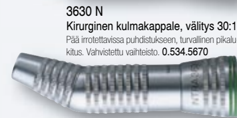
3630 N Kirurginen kulmakappale, välitys 30:1 Pää irrotettavissa puhdistukseen, turvallinen pikalukitus. Vahvistettu vaihteisto. 0.534.5670